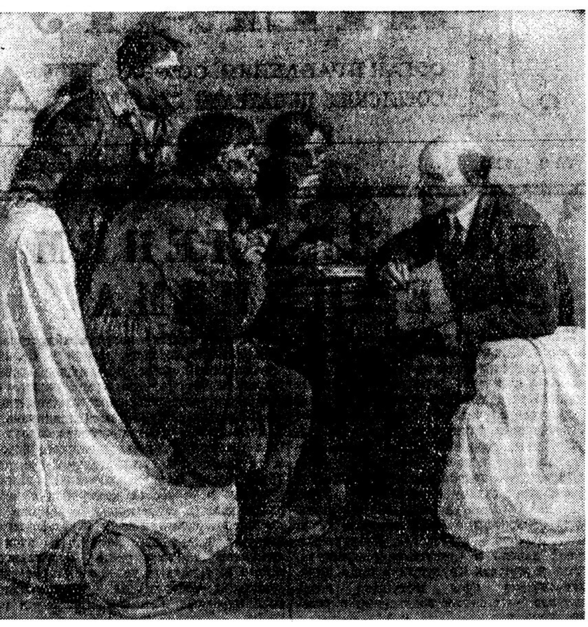
ХОДОКИ У В. И. ЛЕНИНА

Произошел величайший исторический переворот, равный по своему значению Октябрьской революции. — крестьянство перестало быть «преступным капиталистическим классом». Оно бесноворотно вступило на путь социализма.